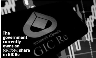
The government currently owns an 85.78% share in GIC Re

The Union Ministry of Finance will dilute a 6.78 per cent stake in public-sector reinsurance company General Insurance Corporation of India (GIC) Re to garner around 4,700 crore. The stake sale, for the first time since the listing of the reinsurance company in 2017 through the offer-for-sale (OFS) route, will begin on Wednesday for non-retail investors.