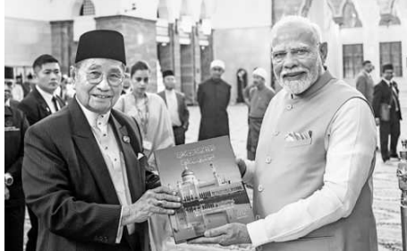
Prime Minister Narendra Modi during a visit to Omar Ali Saifuddin Mosque, in Brunei on Tuesday

Prime Minister Narendra Modi on Tuesday said he was looking forward to strong ties with Brunei, as he arrived here on the first leg of his two-nation trip meant to strengthen cooperation in sectors like defence, trade and investment, energy as well as people-to-people exchanges. Modi, the first Indian Prime Minister to travel to Brunei on a bilateral visit, said he was looking forward to his meetings with Sultan Hassanal Bolkiah and other